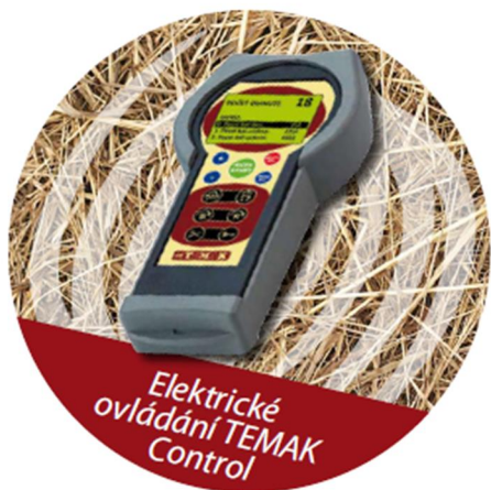
Elektrické ovládání TEMAK Control